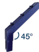
Bayoneta con ángulo de 45°